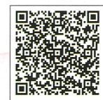
臺灣眷村文化 導覽地圖