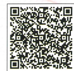
國防軍事公園 導覽地圖