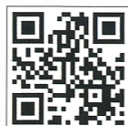
國防報告書 (漫畫版)

以漫畫方式介紹國防軍備和戰略等相關資訊，由國防部編繪，可供教學解說播放或教師參閱。