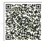
軍事歷史古道 (步道)風景 區導覽地圖