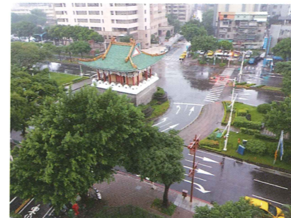
演習時路上禁止人車通行

國慶日的國軍表演可視為是一種軍事演習，我們平常生活中也會遇到其他軍事演習，教師可利用手機或電腦播放萬安演習警報，和學童討論對萬安演習是否有任何相關印象（播放警報、馬路上沒有車輛行駛、行人要躲進建築物、室內要熄燈等），目的是躲避炸彈空襲，是「防空」演習。