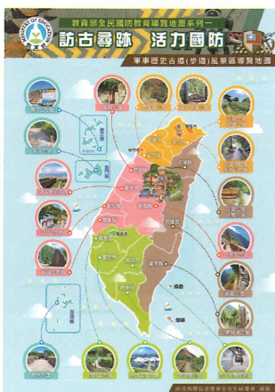
軍事歷史古道(步道)風景區導覽地圖

介紹全國可供實地走訪的軍事公園、軍史博物館或古蹟等，能認識各地區相關的軍事歷史，可作為校外活動參考資料。