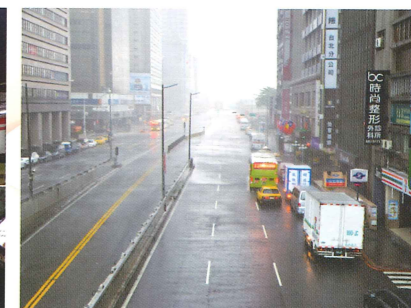
演習時路上所有車輛都要靠邊停駛