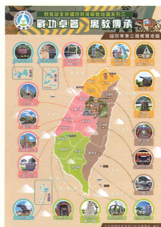
國防軍事公園導覽地圖