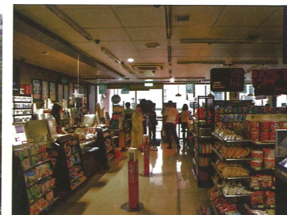
演習時行人躲進商店並熄燈