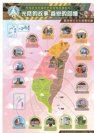
臺灣眷村文化導覽地圖